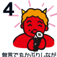
無言で丸かぶりしながらお願いごとをしましょう。