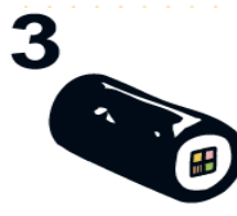
巻ずしを切らずに