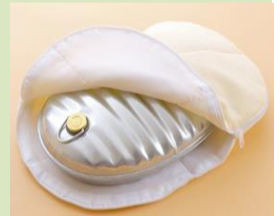
乾燥を防ぎ、全身を温める「湯たんぽ」