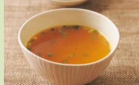
【人参スープ】 ウイルスの予防