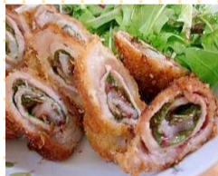
梅と大葉のロールカツ