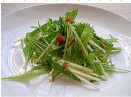
かりかり梅と水菜のサラダ

食での縁起のよいものは、「 梅 」です。平安時代に、天皇が疫病に苦しむ人々に梅を食べさせ救いました。また、自らが倒れた時に梅を食べたことで回復した言い伝えがあり、それが申年だったことから、申年の梅が薬として広まったそうです。また、今年の恵方は「 南南東 」です。節分の日には、恵方を向いて巻き寿司を食べましょう！