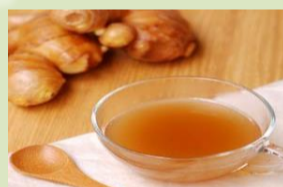
【生姜湯】 咳と痰きりに