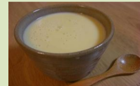
【卵酒】 消化が良く栄養豊富