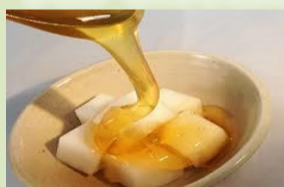
【大根アメ】 喉の痛みや咳