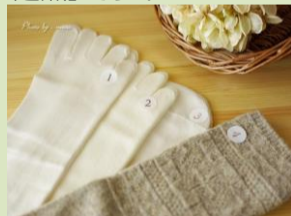
話題の重ね履き「冷え取り靴下」

「冷え」こそがすべての病気の原因であると考え、衣・食・住・息・動・想の生活、環境すべてに渡って、冷えを取るという考え方が冷え取り健康法と言われています。重要なのは「頭寒足熱」です！