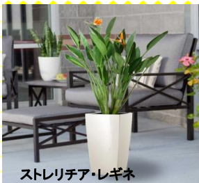
ストレリチア・レギネ