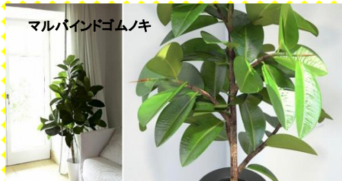
マルバインドゴムノキ