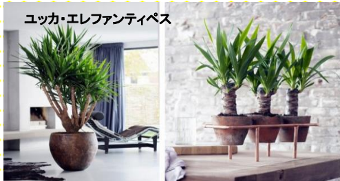
ユッカ・エレファンティペス

↓直射日光大好きな観葉植物をご紹介します↓暑い夏場に窓辺に飾っても、強く美しく育ってくれます。