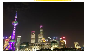
上海の夜景です。360度見渡す限りの夜景に感激しました。

～編集後記～これから梅雨の時期に入り、気づいたら今年も前半を終えようとしています。今年の夏も例年より「猛暑」と予報されておりますので、夏の暑さにばてないよう今の内から体力作りに励みましょう！さて、先月ハウスマーケット社員一同で上海に行ってきました。お天気にも恵まれ、上海の文化や風土を体感することができ、またひとつ良い思い出ができました！これからイベントの多い時期となりますので、皆様も心に残る思い出を作ってください！ 編集部/湯浅