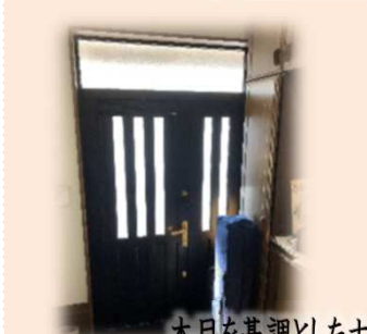
木目を基調としたナチュラルモダンな玄関へ