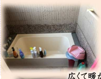
広くて暖かいユニットバスへ