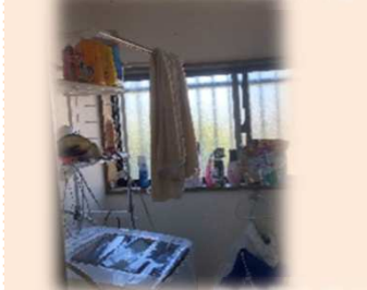
多機能な洗面化粧台と収納棚へ