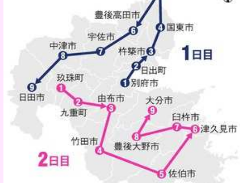
県内の聖火リレールート

【日本の高度技術光る】桜をモチーフとしており、5つの花弁から上がる炎が一つの赤い聖火を作る。