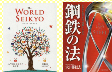
2020上半期ベストセラー本

読書から得られることってなんでしょう？ハウツー本は実用性がうりです。小説は、物語を擬似体験することです。すぐにではありませんが、人間性に深みができます。読書は自己投資ともいえるでしょう。読書で得た知識を「知識のまま」で終わらせず「実践」してこそ意味があるのです。