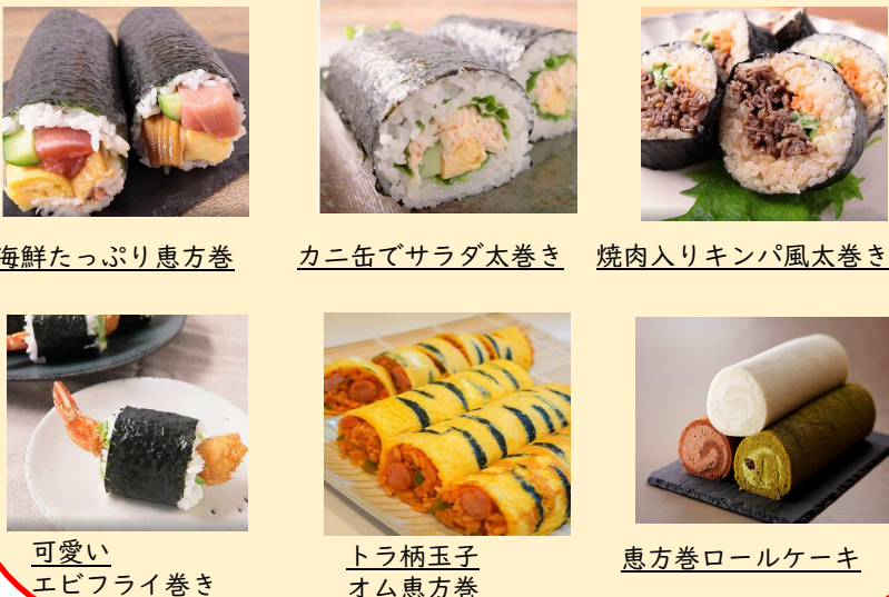
海鮮たっぷり恵方巻 カニ缶でサラダ太巻き 焼肉入りキンパ風太巻き 可愛いエビフライ巻き トラ柄玉子オム恵方巻 恵方巻ロールケーキ